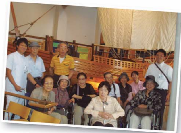
きじま在宅介護センター

今後もまた、利用者の方々に喜んで頂ける企画をセンター職員一同で考え、リハビリへの意欲向上と日常生活の刺激に繋げていけるような外出レクリエーションを続けて行きたいと思っています。