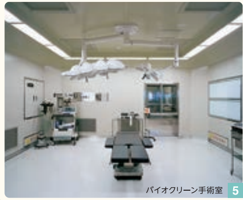
バイオクリーン手術室 5