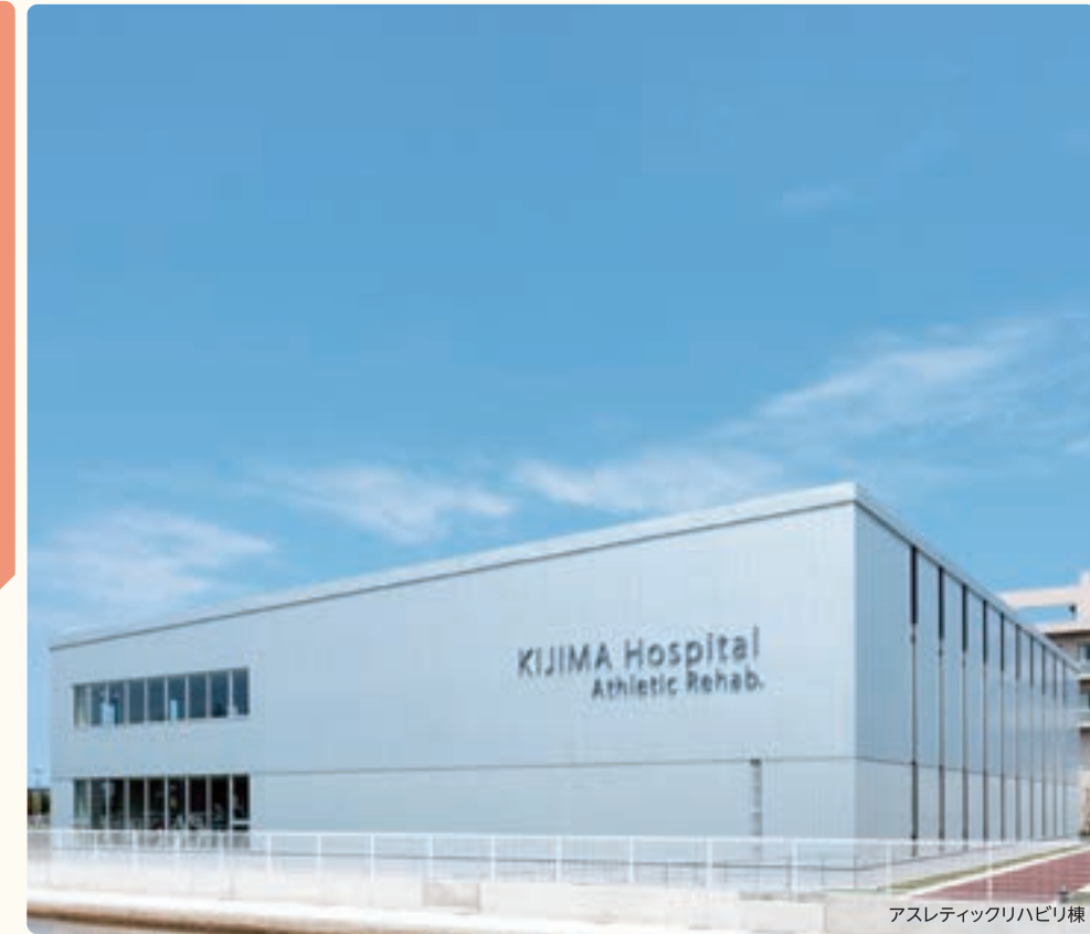
アスレティックリハビリ棟