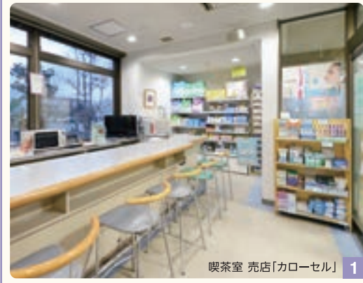
喫茶室 売店「カロール」 1