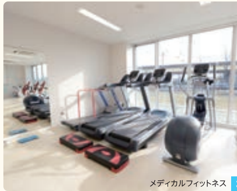
メディカルフィットネス 3