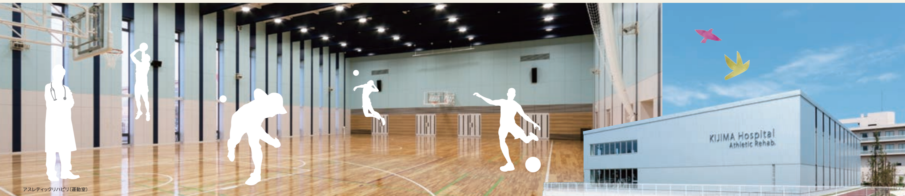
アスレティックリハビリ(運動室)