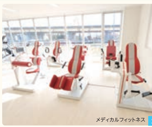
メディカルフィットネス 2