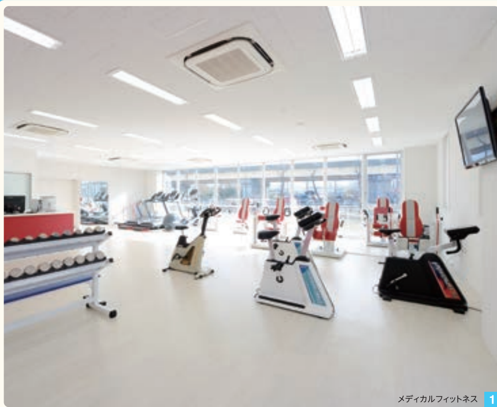
メディカルフィットネス 1