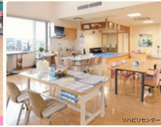
リハビリセンター