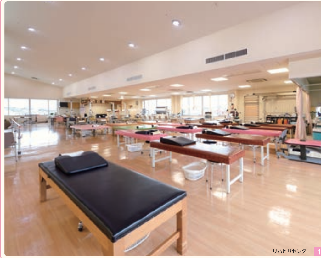
リハビリセンター 1